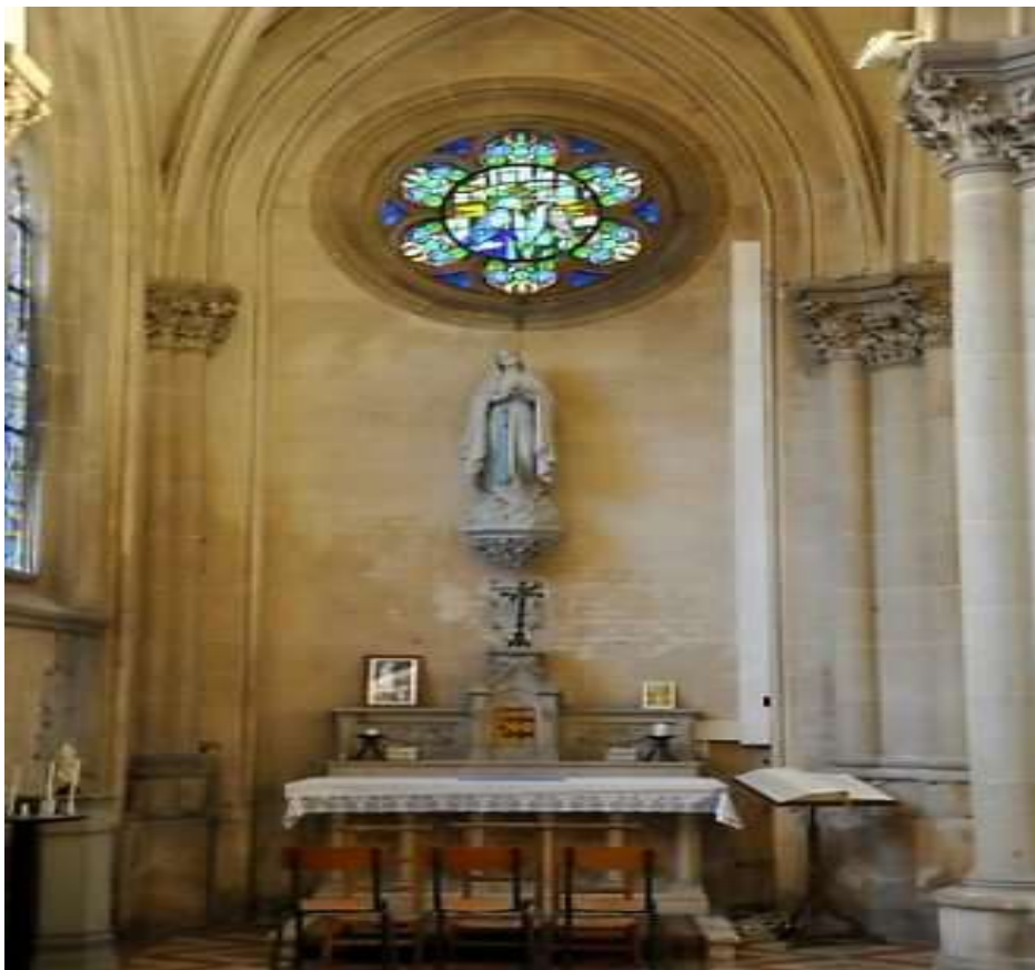
Chapelle de la Vierge, dans le bas-côté gauche