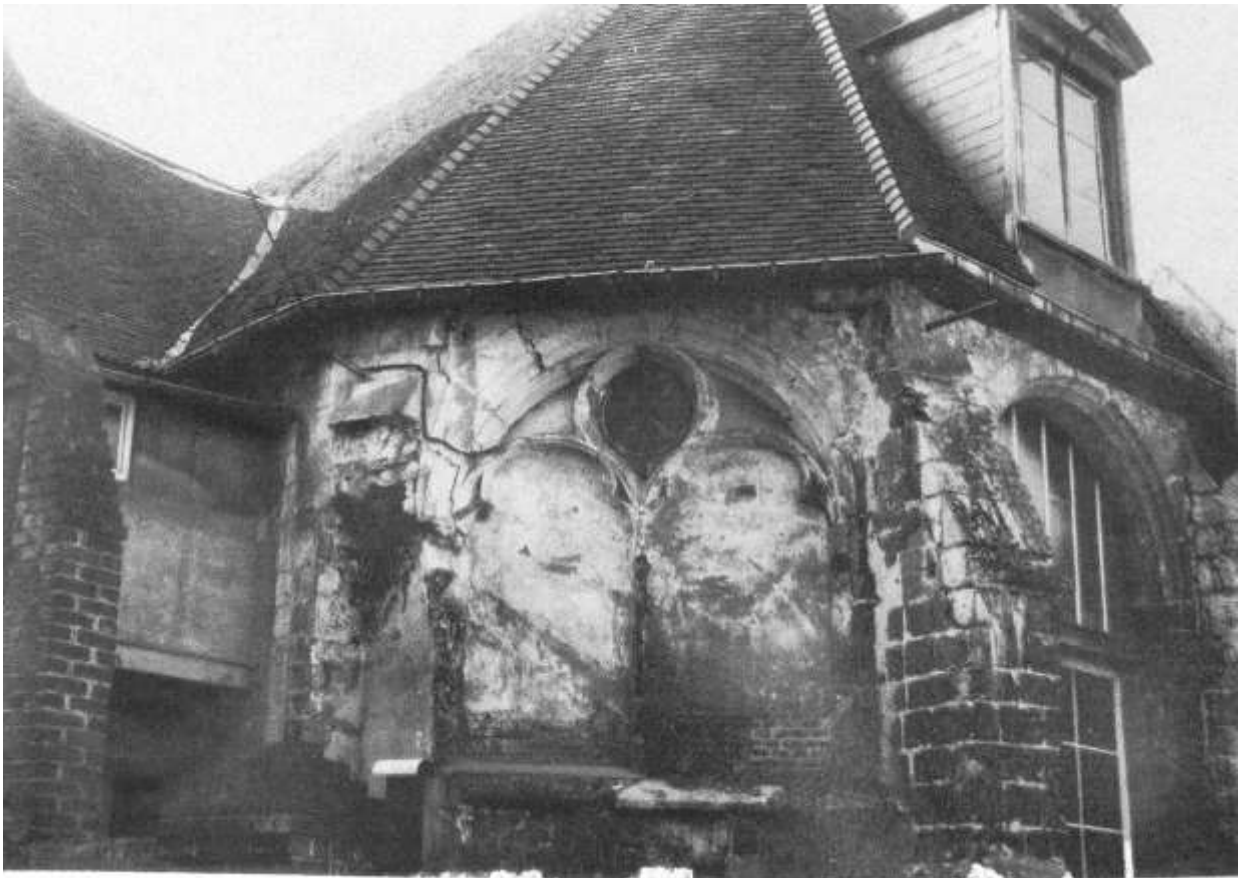
eglise St Jacques de Richebourg L'abside du chœur vue du côté nord-est

Ces vestiges se situent actuellement entre la rue St Jacques et la rue Odet de Chatillon.