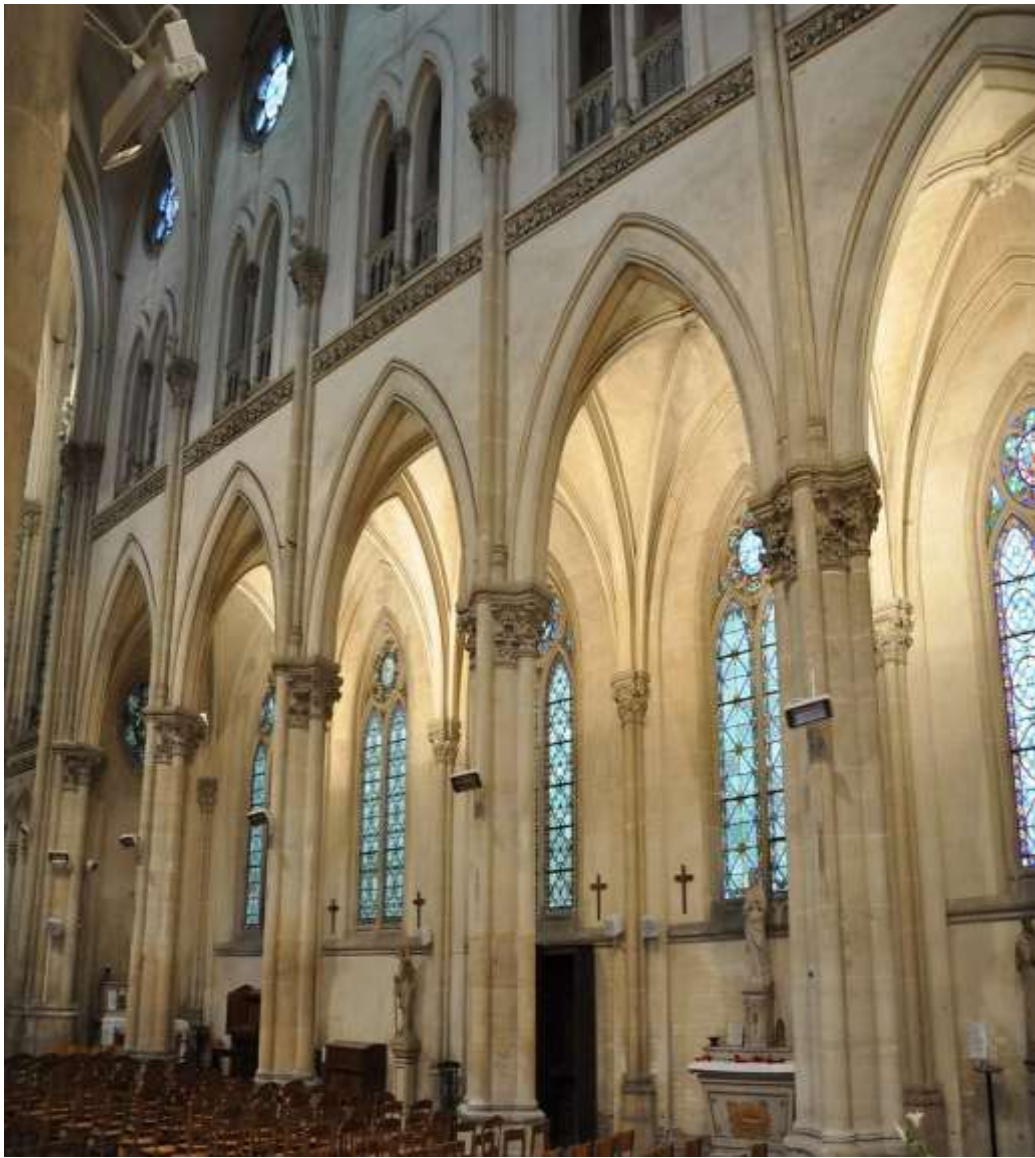
Elévations droites dans l'église. Les chapiteaux des piliers, ceux des pilastres (qui reçoivent les arcades de la voûte) et la corniche sculptée