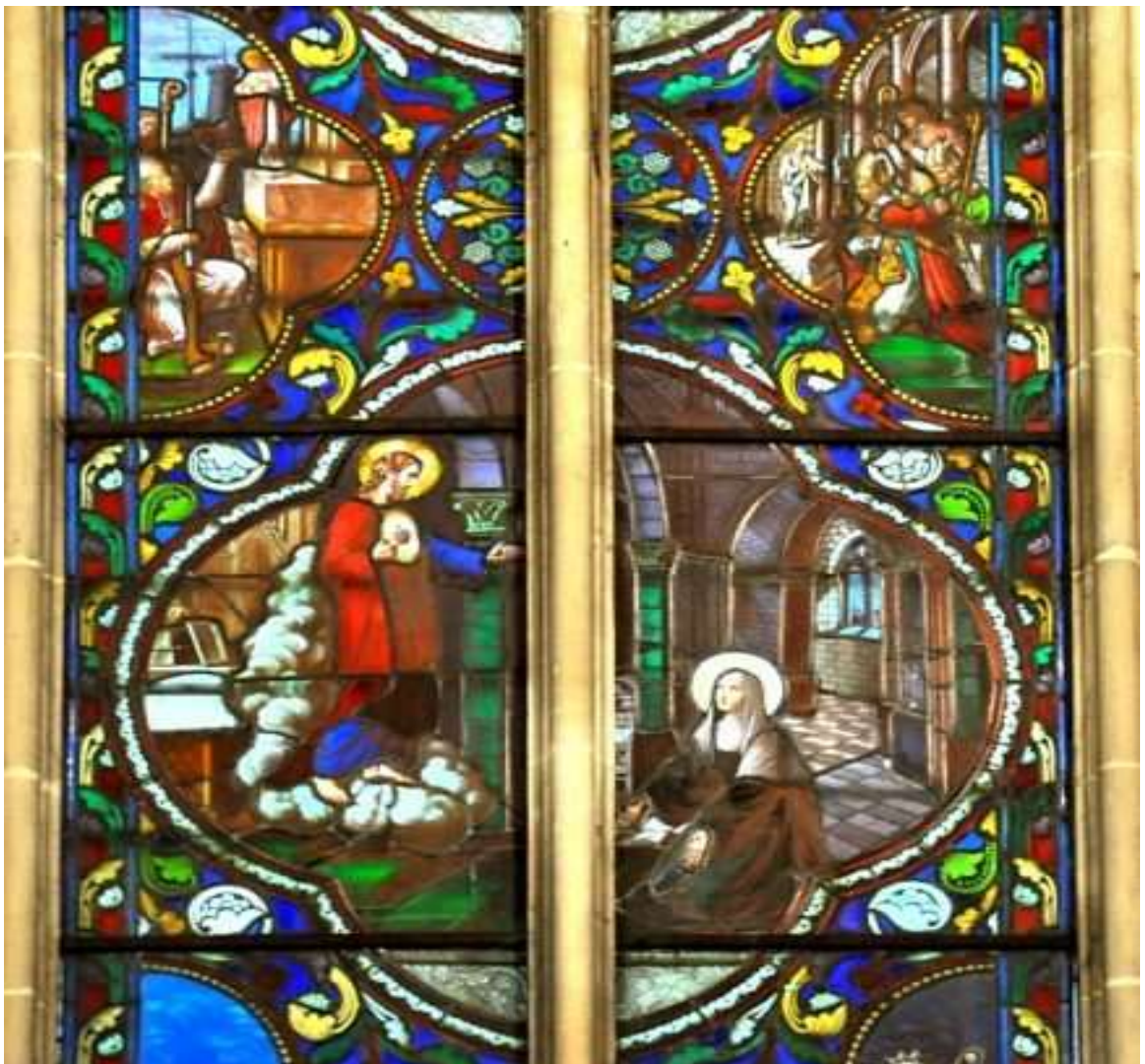
Détail de la verrière du chœur : Apparition de Jésus