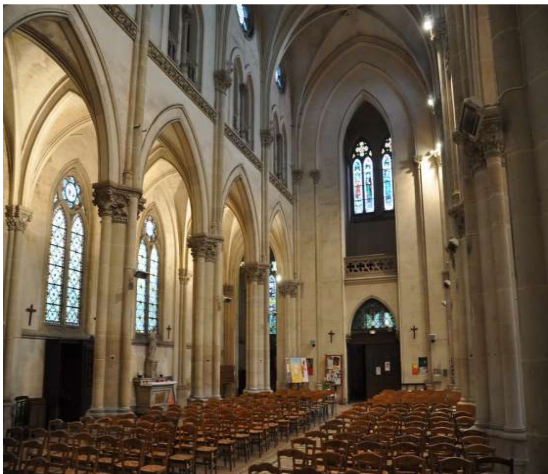
Vue de la nef et de la façade depuis l'autel